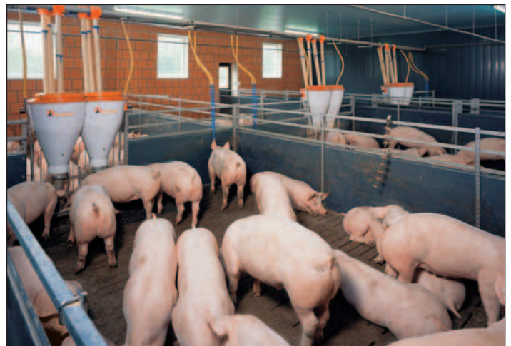
Pohled na skupinový kotec výkrmu s PigNic-Jumbo