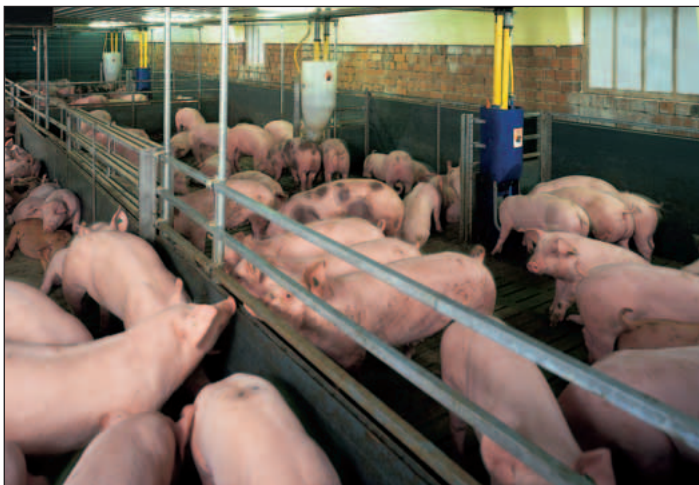
Krátké dělicí stěny se selekčními dvířky usnadňují kontrolu zvířat a selekci